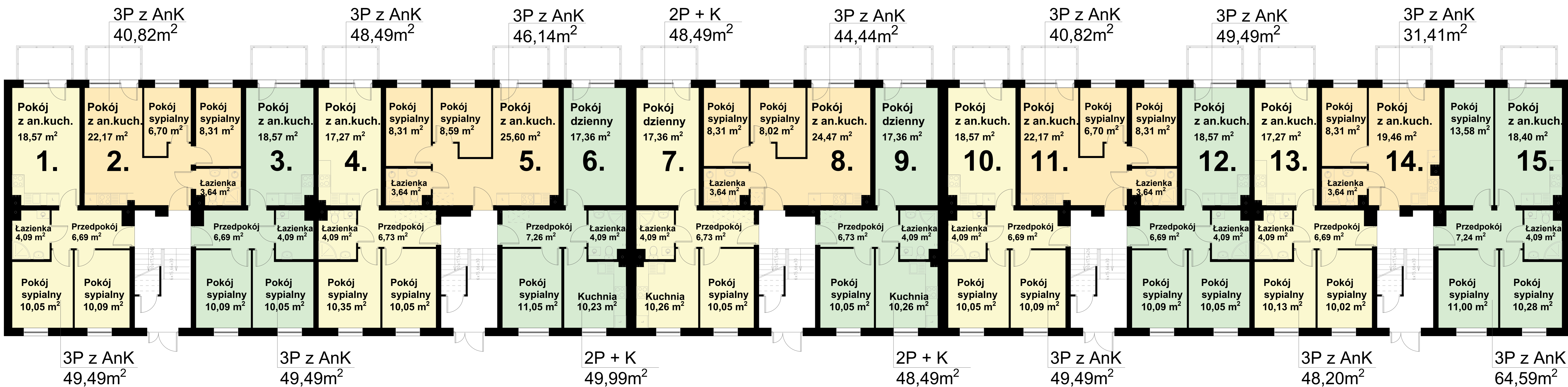
RZUT PARTERU I PIERWSZEGO PIĘTRA